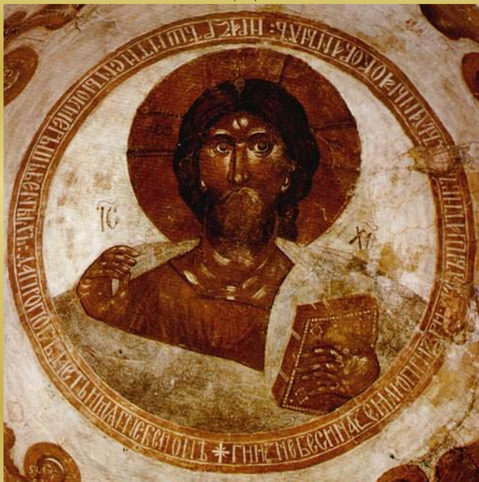
Спас Вседержитель. Роспись купола церкви Спаса Преображения на Ильине улице в Новгороде Великом . Феофан Грек . 1378 г