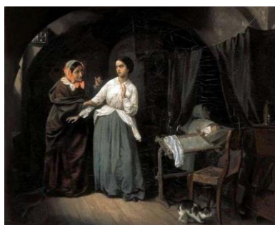
Н. Шильдер "Искушение"

Подход Третьякова принципиально отличался от подхода других коллекционеров. Во-первых, он планировал сделать галерею общедоступной. Во-вторых, при покупке картин руководствовался не столько личными вкусами, сколько мыслью о полном и объективном освещении отечественного художественного процесса.